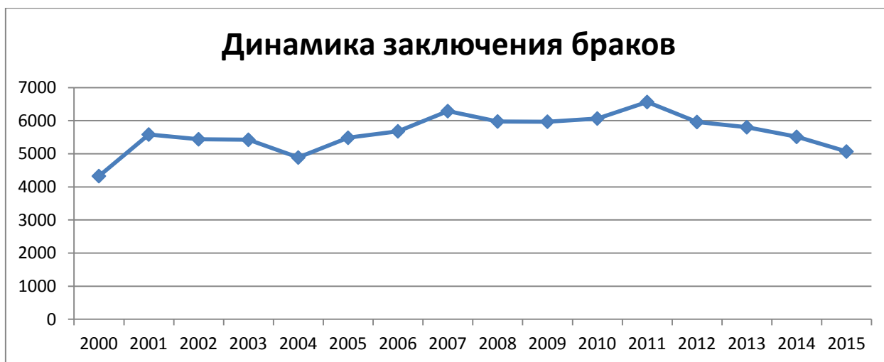
Количество заключенных браков в Костромской области

На слайде отражена динамика по заключению брака за последние 15 лет.